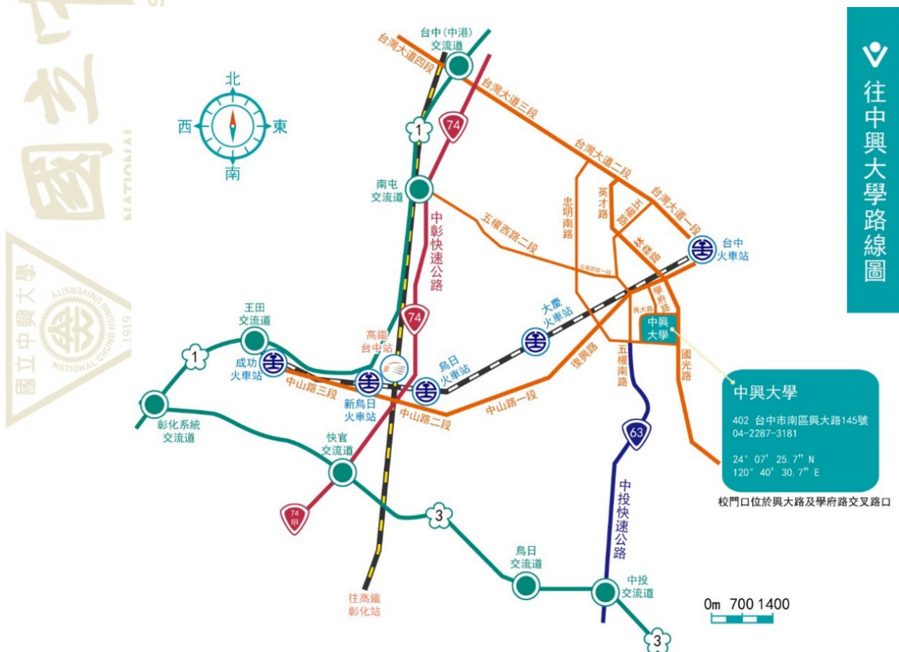
國立中興大學交通路線參考圖

(二)由國道3號福爾摩沙高速公路：209K 中投(台中)交流道下→接63線中投快速公路，往臺中市區方向→五權南路→忠明南路(右轉)→興大路(左轉)→中興大學。